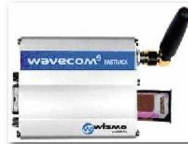
Wavecom Fastrack M1306B